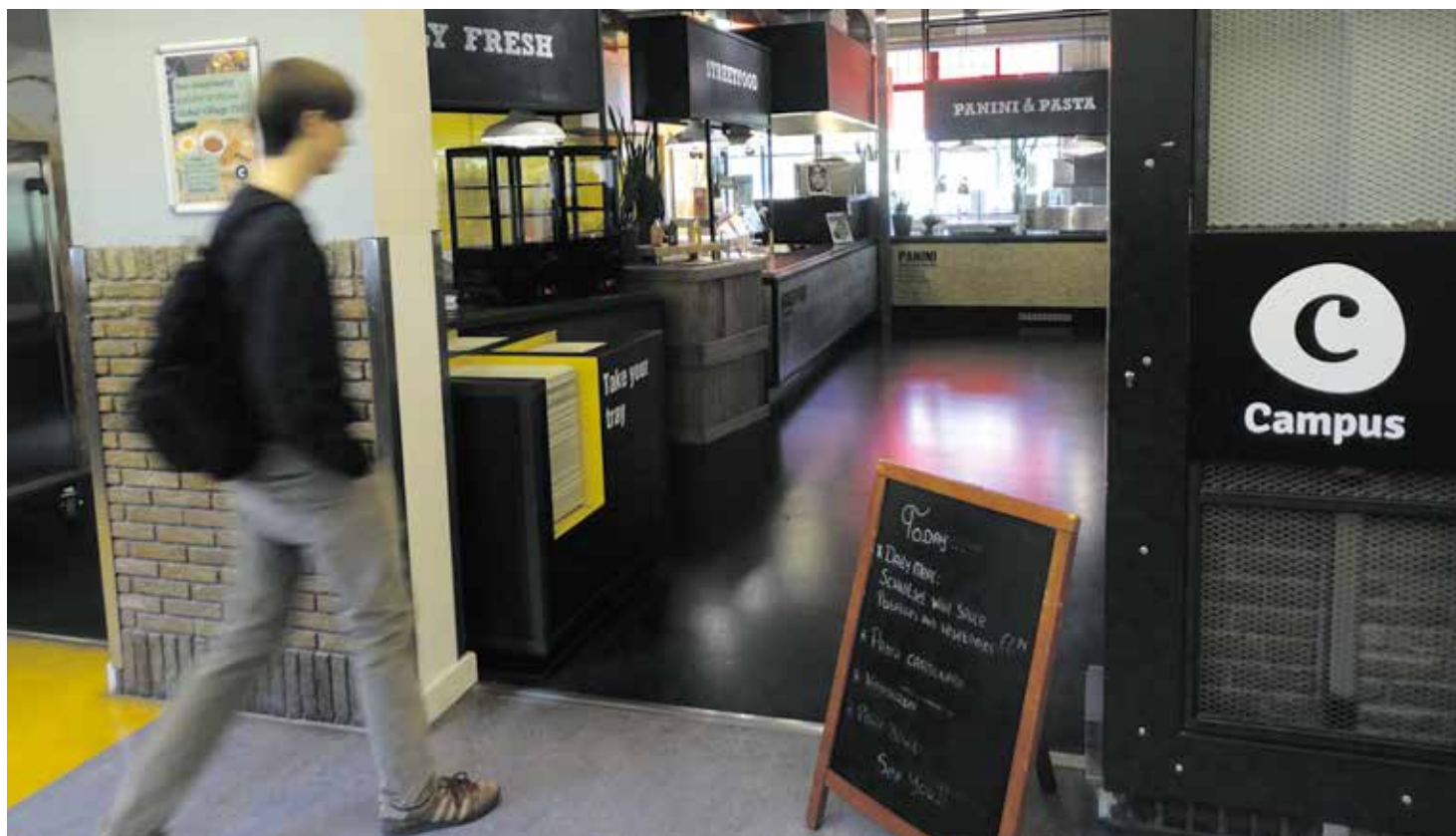
Mensa Tongersestraat