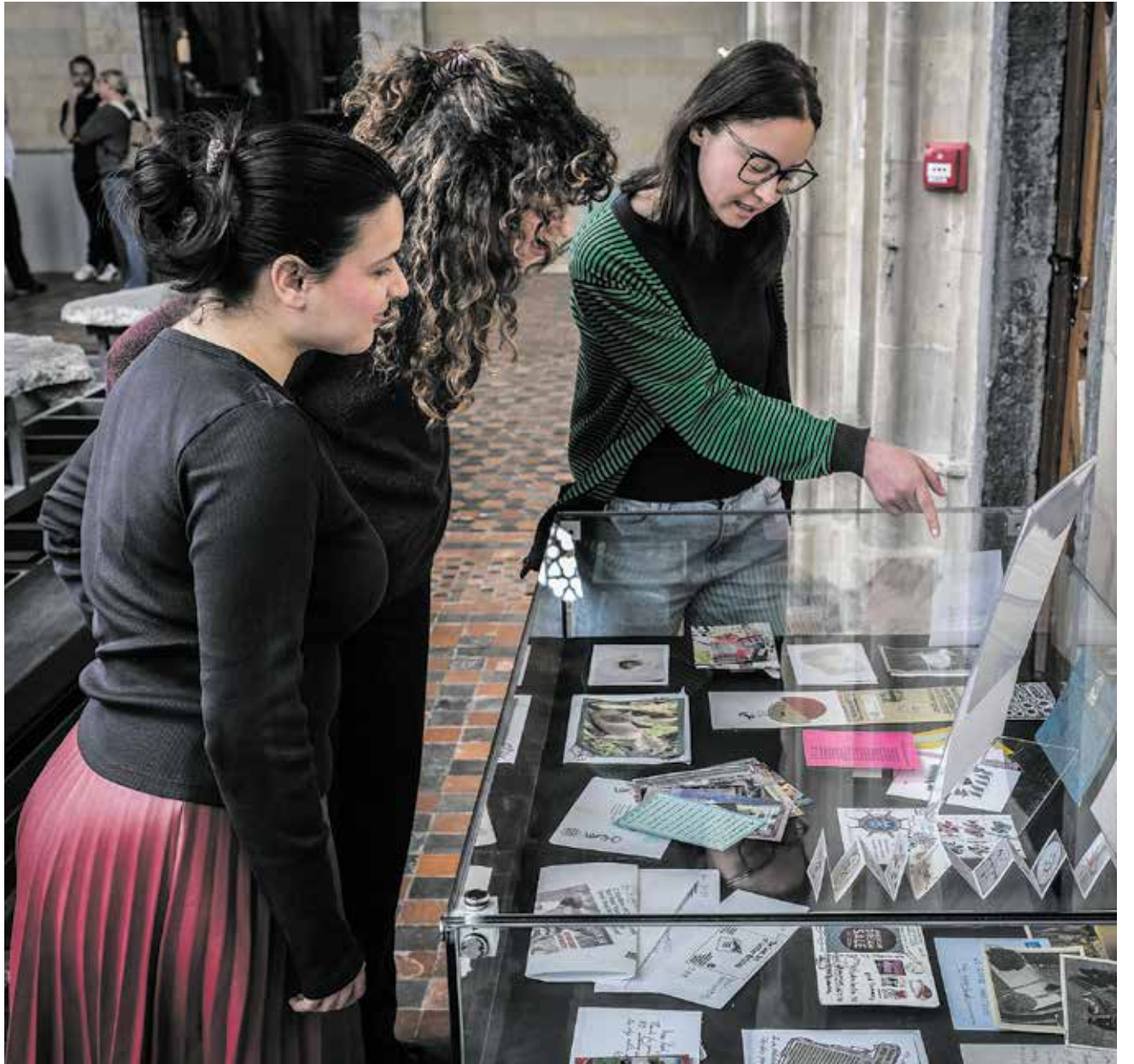
FASoS-studenten bekijken tentoonstelling